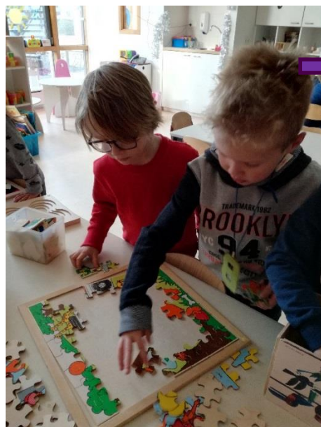
Foto 3: Samen moeilijke puzzels maken kunnen deze kanjers ook al! Het is even passen en meten, maar er wordt dan ook flink gejuicht wanneer een stukje op zijn juiste plek zit.