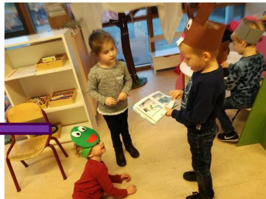
Foto 2: De kinderen spelen het verhaal na aan de hand van het boek 'Kikker in de kou'. De rollen verdelen ze zelf, waardoor er een mooi rollenspel ontstaat in de poppenhoek.